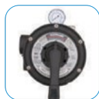
Πολλαπλή βαλβίδα Vari-Flo™ Vari-Flo™ 6-position valve

Selector valve: Included (SP0719SE or SP0715X62E).