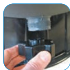
Αποστράγγιση με τάπα Drain with plug