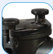
Διάφανο καπάκι See-through strainer cover