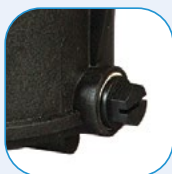
Τάπες αποστράγγισης για εύκολη χειμερινή συντήρηση Drain plugs for an easy wintering