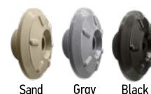
Sand Gray Black

Διαθέσιμο και σε: Also available in: (see page 203)