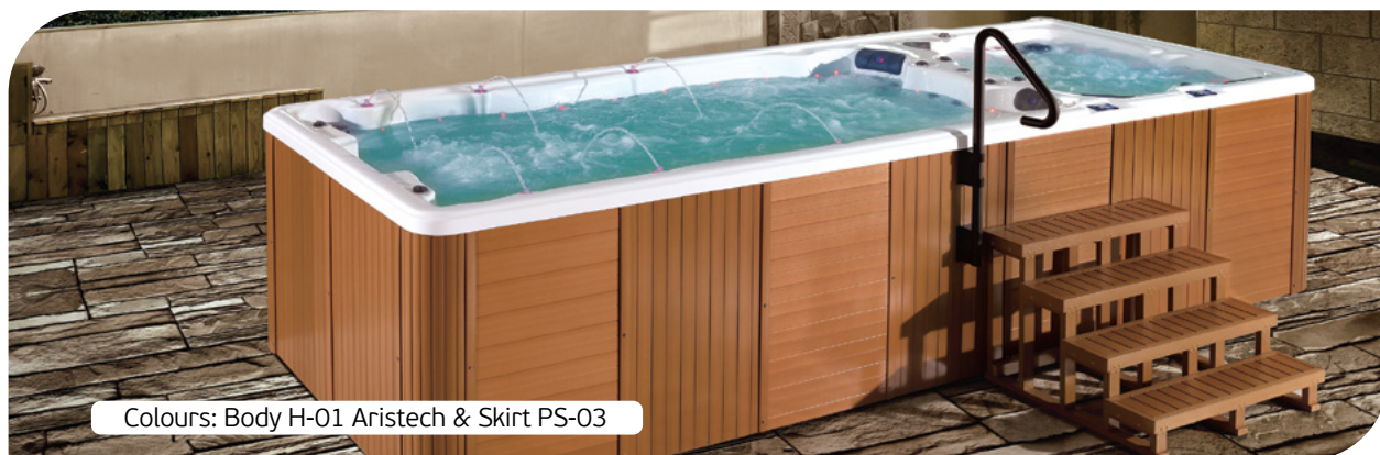
Colours: Body H-01 Aristech & Skirt PS-03