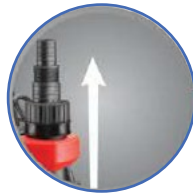
Κατακόρυφη έξοδος Vertical exit