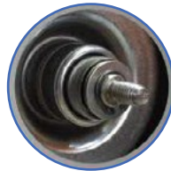
Μηχανικός στυπιοθλίπτης Mechanical seal