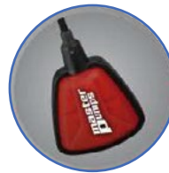
Αυτόματη ή χειροκίνητη λειτουργία Automatic or manual mode