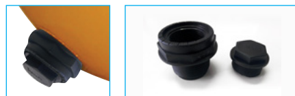
Διπλή τάπα αποστράγγισης. Double drain for filter media or water discharge.