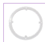
Πλαστικός δακτύλιος στήριξης. Plastic fixing ring.