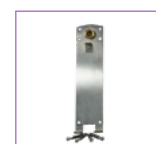
Ανοξείδωτη πλάκα στερέωσης. S.S. fixing plate.